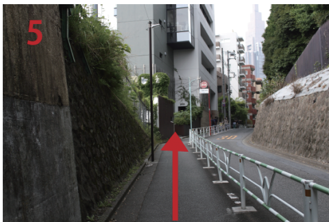
高架下をくぐり抜けて坂を上る