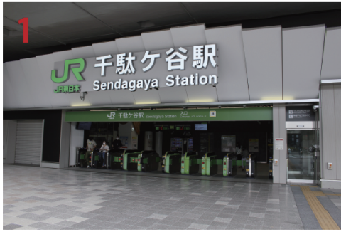
↓千駄ヶ谷駅は改札を出る