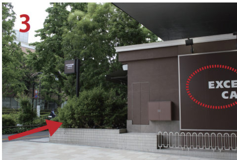
↓ 右手にはエクセルシオールカフェ