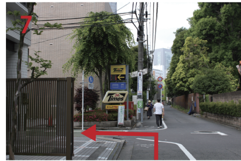
↓ 黄色い看板のtimesを左に曲がる