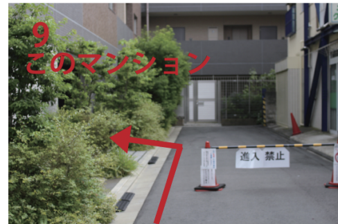
↓ 左手のマンション 右は北参道クリニック