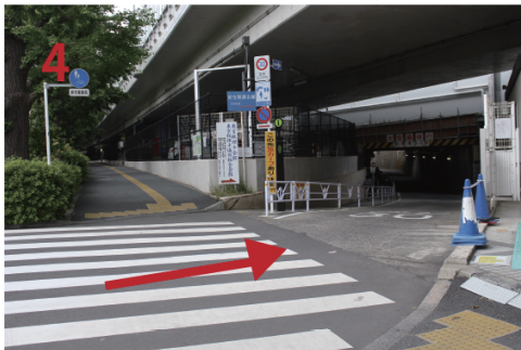
↓ カフェを超えて右に曲がる