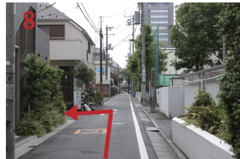
↓ 右側に日科技研の所を左に曲がる