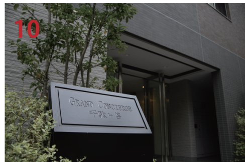
グランドコンシェルジュ千駄ヶ谷 部屋番号はご予約のお客様にお知らせします